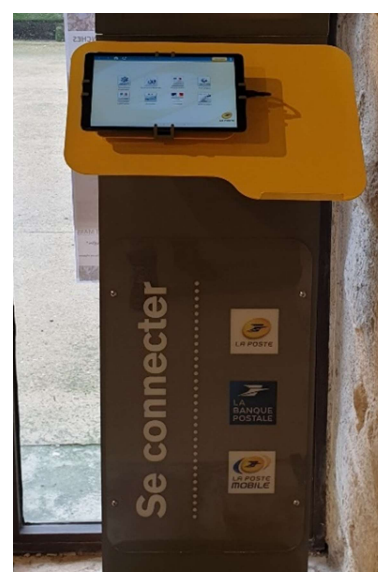
Borne accueillant la tablette